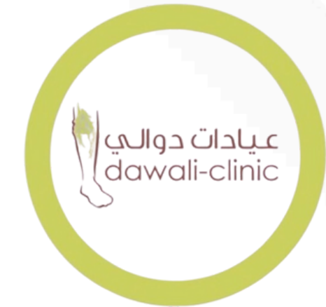
عيادات دوالي dawali-clinic