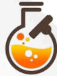
مختبر الأول الطبي FIRST MEDICAL LAB.